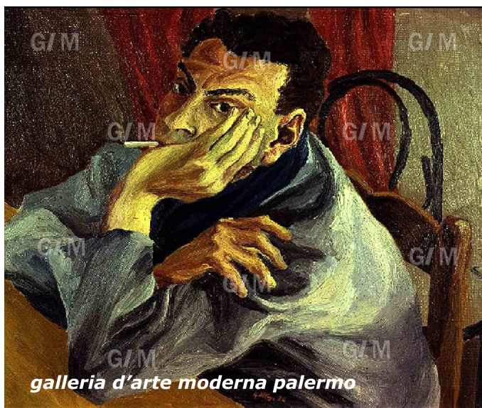
Renato Guttuso, Autoritratto , 1936, olio su tela, cm 49 x 60,5, Galleria d'Arte Moderna, Palermo.

Come per il cinema, si può distinguere uno Sciascia che scrive d'arte (presentazioni, elzeviri, saggi critici) da uno Sciascia appassionato d'arte (nella veste a lui non tanto congeniale di collezionista, e in quella, diversamente più autentica e spontanea, di frequentatore di atelier e gallerie d'arte) e, infine, da uno Sciascia che mutua nella sua scrittura narrativa immagini dall'arte figurativa 11 . Un interesse ampio quello dello scrittore che si muove dalla passione per le stampe e la grafica in genere – come attesta la cospicua collezione che donò alla Fondazione Sciascia a Racalmuto, costituita da circa duecento disegni e incisioni con i ritratti degli scrittori da lui più amati dal Cinquecento al Novecento, raccolti nei numerosi viaggi e soggiorni a Parigi, Milano, Torino, Parma, Firenze e Roma – alla vasta produzione di scritti d'arte articolatasi attraverso la critica d'arte militante in presentazioni, cataloghi di mostre, nella stampa periodica e nelle riviste d'arte, e su argomenti quali scultura, pittura, disegno, incisione, architettura e fotografia 12 . Dall'interesse per l'arte moderna in Sicilia, come attesta la lettura sociologica sul Ritratto di Ignoto di Antonello da Messina del Museo Mandralisca di Cefalù 13 , o gli scritti dedicati a Francesco Laurana, Caravaggio 14 , Filippo Paladini 15 e Pietro d'Asaro 16 ; o i rapporti con la cultura figurativa contemporanea, non soltanto siciliana.