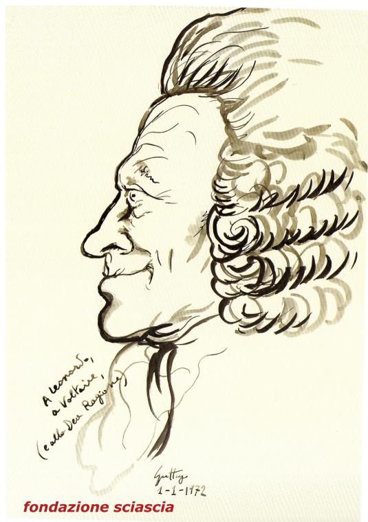
Renato Guttuso, Voltaire , 1972, disegno a china, 355x255 mm, Fondazione Sciascia, Racalmuto.

Per quanto riguarda i ritratti degli scrittori del passato da lui raccolti, e ora conservati alla Fondazione Sciascia a Racalmuto, si possono citare qui almeno le due chine di Guttuso donate allo scrittore per la sua collezione: si tratta di due ritratti di Voltaire, scrittore amatissimo da Sciascia, di cui uno di profilo, dove l'artista appose una significativa dedica: «A Leonardo, a Voltaire e alla Dea Ragione», a dimostrazione del sodalizio culturale tra i due; e l'altro che rappresenta una sorta di studio “divertito” del volto dello scrittore francese visto nelle varie espressioni, anche qui con una scritta di Guttuso: «pour Voltaire» 17 .