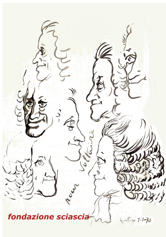
Renato Guttuso, Pour Voltaire , 1973, disegno a china, 700x550 mm, Fondazione Sciascia, Racalmuto.

legami esistenti nella seconda metà del Novecento tra critica letteraria e critica d'arte 18 . Sciascia coinvolgeva spesso i suoi amici pittori per illustrare il periodico nisseno, come nel caso del numero del 1955 dedicato a Nino Savarese, per il quale aveva chiesto a Guttuso e Maccari una serie di disegni con i ritratti del grande scrittore ennese 19 .