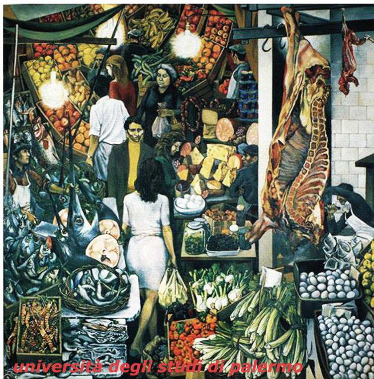
Renato Guttuso, La Vucciria , 1974, olio su tela, 300x300 cm, Palazzo Steri, Palermo (proprietà dell'Università degli Studi di Palermo, donazione dell'artista).

E sono richiami confermati anche dalla critica ufficiale. Basti leggere, ad exemplum , le mirabili pagine di Calvesi del 1985, quando osserva «la Sicilia, la terra per antonomasia della nascita e del lutto, dei sogni e delle visioni che continuamente la rievocano, la Sicilia chiama Guttuso, lo chiama con i suoi mostri impietriti in bizzarre contorsioni, sul muro di cinta di villa Palagonia [...]» 51 .